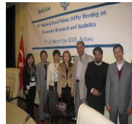
На заседании национальных координаторов по статистике и исследованиям ОЭС, Анкара