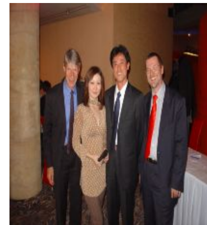
С представителями Всемирного Банка по проекту подготовки Генерального Плана развития статистики Казахстана