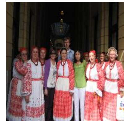
Поездка в Хорватию

В течение 2008 года Агентство в целях изучения мирового опыта осуществило встречи со многими статистическими службами мира. Среди них можно отметить Словению (распространение данных), Хорватию (метаданные), Литву (ИПЦ и ИЦП), Италию (статистика ИКТ), Канаду (сельское хозяйство и малый бизнес). Также, запланирован визит в Финляндию для обсуждения сотрудничества и проведения обмена опытом по ГИС и статистике торговли.