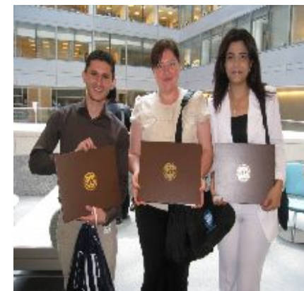
На курсах МВФ по национальным счетам в Вашингтоне

С международным Валютным Фондом Статистическая система Казахстана сотрудничает в рамках ССРД. ССРД является инициативой Международного валютного фонда (МВФ), представляет собой крупнейшее хранилище метаданных в мире. Оба стандарта основываются на четырех аспектах распространения данных: а) характеристики данных (охват, периодичность, своевременность); б) доступность для общественности; с) целостность распространяемых данных; и d) качество распространяемых данных. ССРД исходит из наличия достаточно высоких стандартов данных, и внимание в ее рамках сконцентрировано на распространении данных, прежде всего с точки зрения полной документированности и транспарентности. Двумя важными требованиями ССРД являются – календарь предварительного выпуска, который функционирует в качестве графика распространения, и национальная страница с кратким обзором данных, которая связывает метаданные со значениями показателя. С марта 2003 года Казахстан перешел с ОСРД на ССРД. В рамках общей деятельности МВФ организует учебные курсы по финансовой статистике в Вене, а также по национальным счетам в Вашингтоне, где регулярно участвуют наши сотрудники.