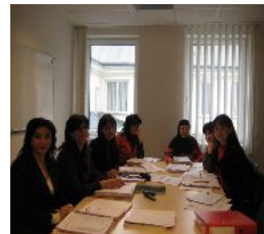
Венские курсы МВФ по госфинансам

Статистическое подразделение Европейской Комиссии. В соответствии с Соглашением о партнерстве и сотрудничестве между Европейским Союзом и Республикой Казахстан 1999 года, двустороннее сотрудничество в области статистики направлено на дальнейшее развитие эффективных статистических систем с целью обеспечения достоверной статистической информации, необходимой