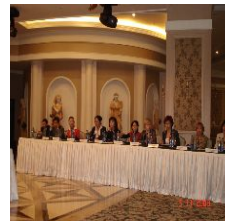
Международный семинар по регистрам