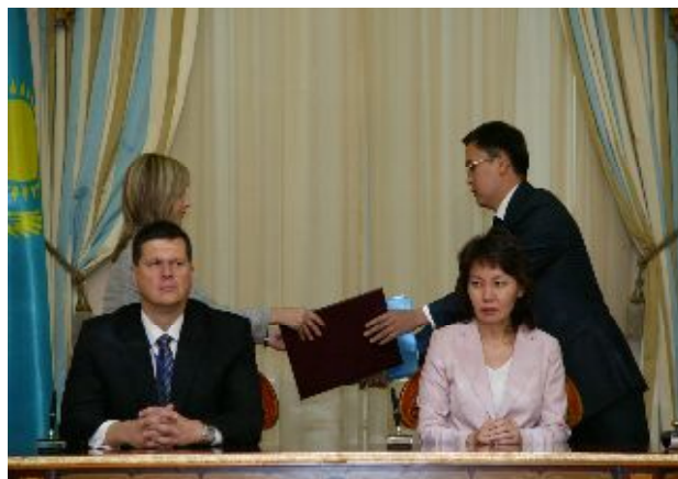
На церемонии подписания Меморандума о взаимопонимании в области статистики в Акорде. Министр Экономики Латвии Касперс Герхардс и Председатель Агентства по статистике Мешимбаева Анар

За период становления международного сотрудничества с 1992 года по настоящее время Агентством были заключены договора и соглашения в многостороннем формате с международными статистическими институтами, в числе которых Статистическая комиссия Организации Объединенных Наций (Статкомиссия ООН), Европейская экономическая комиссия Организации Объединенных Наций (ЕЭК ООН), Организация экономического сотрудничества и развития (ОЭСР), Евростат, Турецкое агентство по международному сотрудничеству (ТИКА), Статистический комитет СНГ. В текущем году Агентство осуществило подписание двусторонних Меморандумов о взаимопонимании со статистической службой Норвегии, 31 октября, и Министерством экономики Латвии, 3 октября.