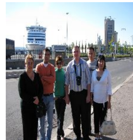
Сотрудники Агентства, Министерства Финансов в ходе визита в Норвегию по административным данным

Нельзя не упомянуть и о совместном сотрудничестве Агентства с Государственным статистическим институтом Турции и Турецким агентством по международному сотрудничеству, в