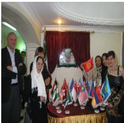
Курсы ЕЭК ООН/СИАТО по экономической статистике