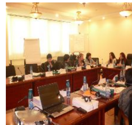
Сотрудники Агентства на семинаре по бытовому насилию, ЕЭК ООН